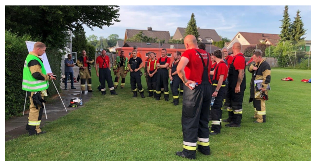
Abschlussbesprechung des Chef Ausbildung mit der Mannschaft