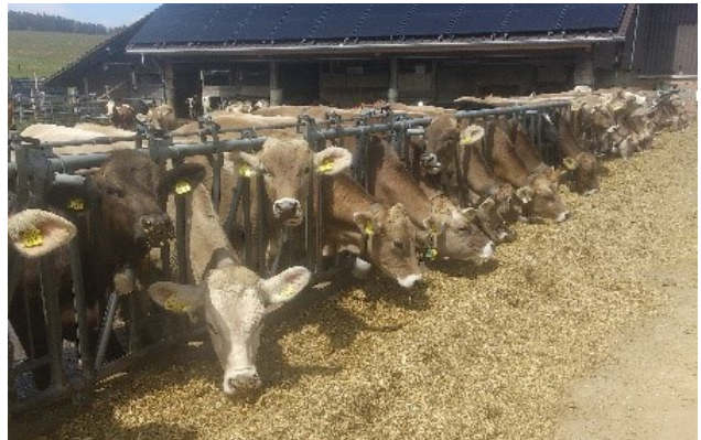
240 Rinder hatten Hunger auf der Horbenalp