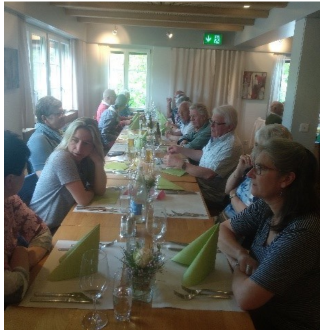
Mittagessen im Alprestaurant Horben