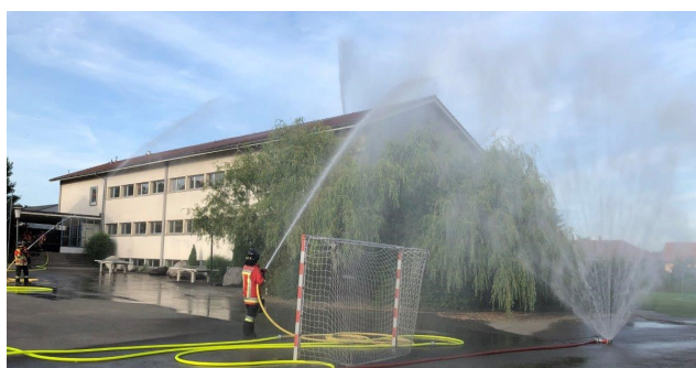
Löschung des Dachstockbrandes der Schule Aefligen