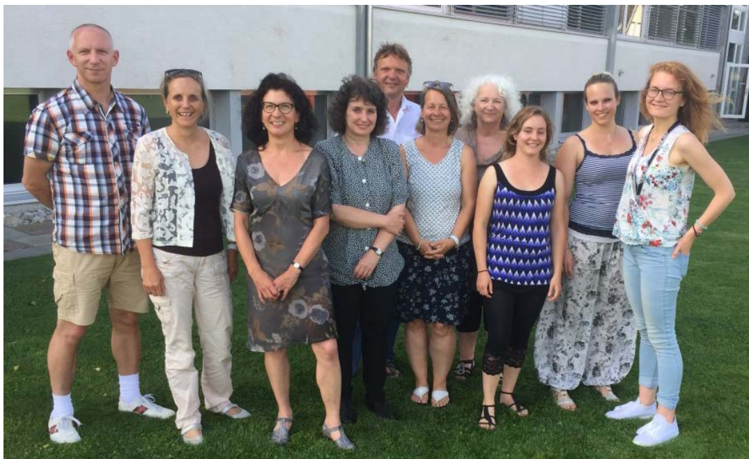
Das LehrerInnen-Team ab Schuljahr 2017/18 (von links nach rechts)

Wir wünschen ihnen alles Gute und viel Freude mit den Kindergarten- und Schulkindern in unserem Dorf.