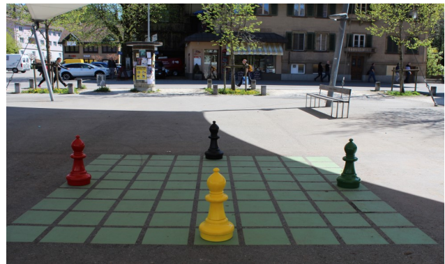
Spiel dich durch..., Langnau / Projektbeitrag à fonds perdu / Bereich Tourismus

Eine Übersicht aller unterstützten Projekte sowie weitere Informationen finden Sie unter https://www.region-emmental.ch/de/regionalpolitik/unterstuetzte-projekte .