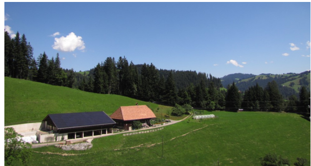
Förderung Solarstrom Emmental / Projektbeitrag à fonds perdu / Bereich Industrie

Nachstehend einige Beispiele geförderter Projekte im Emmental seit 2008: