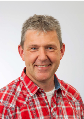
Werte Aeßliçerinnen und Aeßliçer