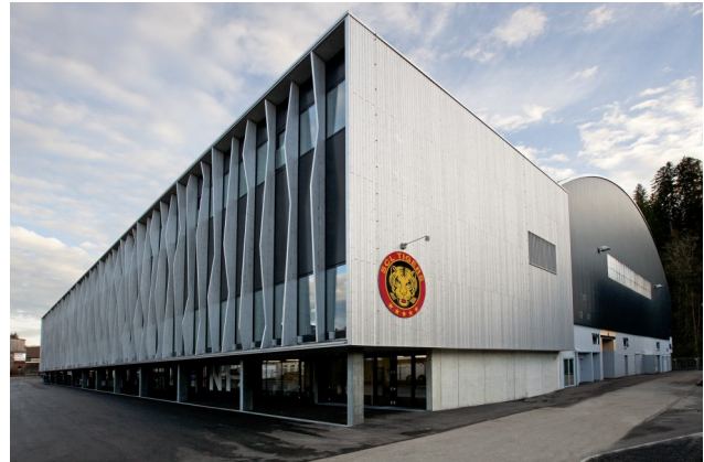
Sanierung & Erweiterung Iffishalle, zinsloses Darlehen, Bereich innovative regionale Angebote

Nachstehend einige Beispiele geförderter Projekte im Emmental seit 2008: