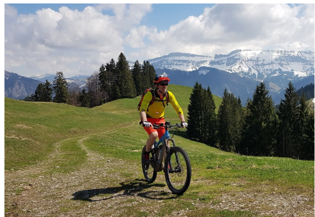
E-Mountainbike-Routen Emmental, Projektbeitrag à fonds perdu, Bereich Tourismus

Eine Übersicht aller unterstützten Projekte sowie weitere Informationen finden Sie unter https://www.region-emmental.ch/de/regionalpolitik/unterstuetzte-projekte .